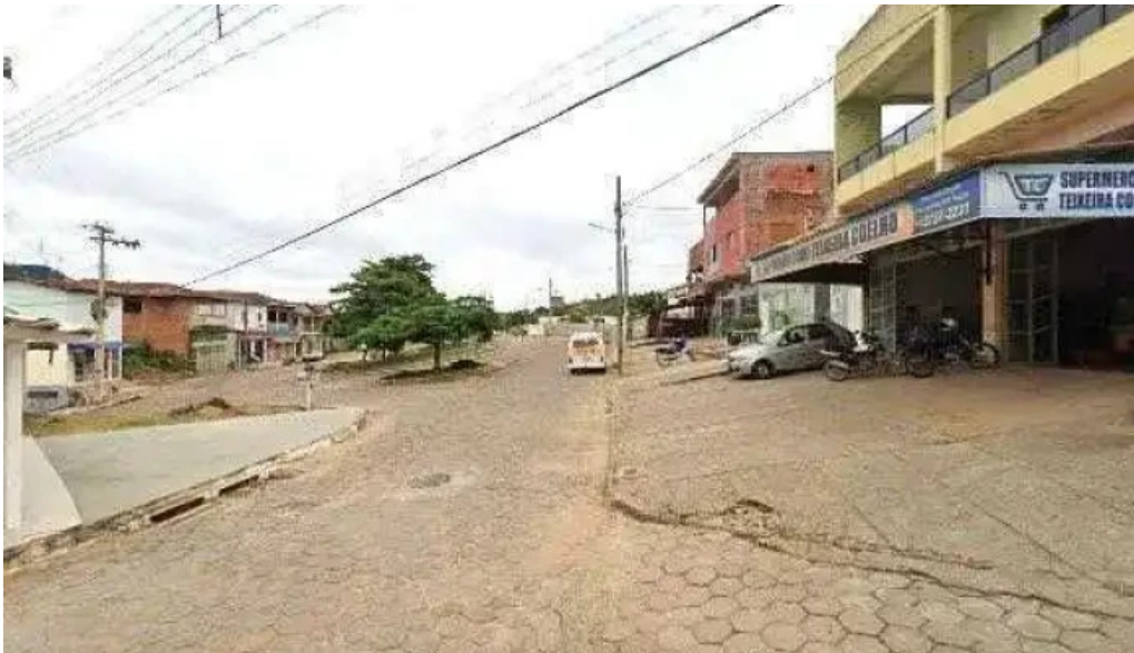
Drogaria multivida farmacia em leliveldia grupo multifarma street view e 360deg