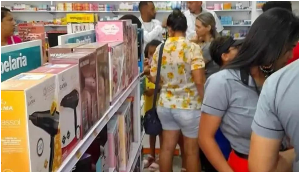
Drogaria multivida farmacia em leliveldia grupo multifarma tudo