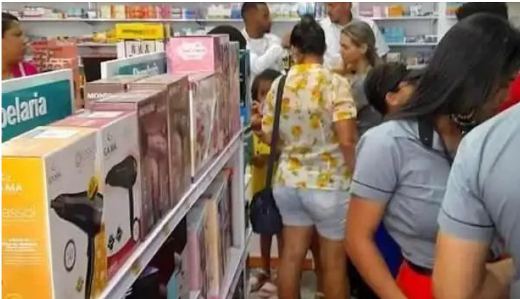
Drogaria multivida farmacia em leliveldia grupo multifarma berilo