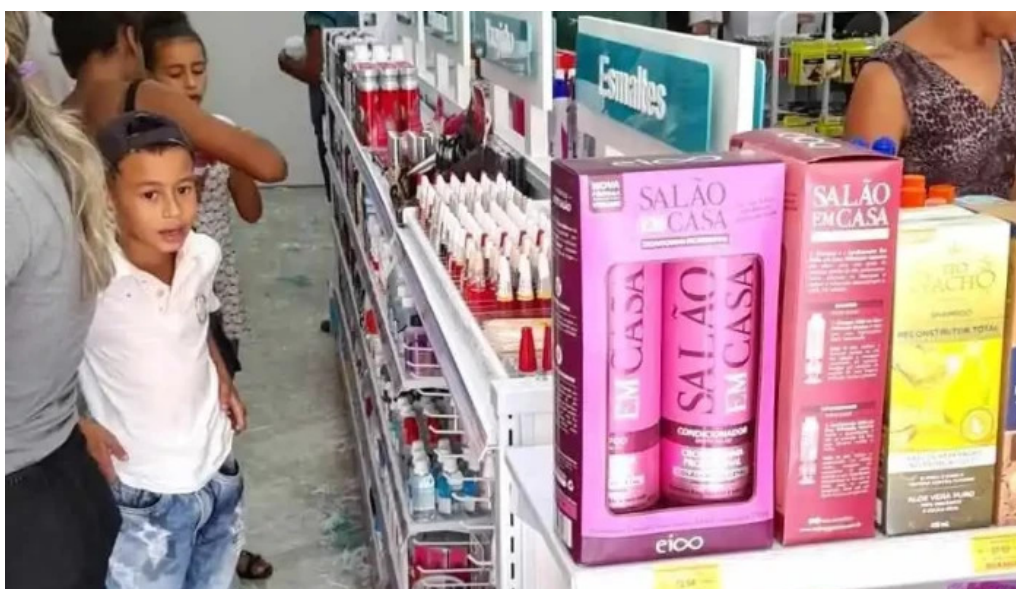
Drogaria multivida farmacia em leliveldia grupo multifarma do proprietario