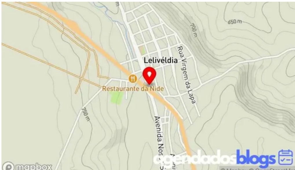
Drogaria multivida farmacia em leliveldia grupo multifarma mapa