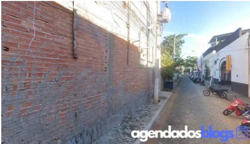
Farmacia ayrao de itaocara itaocara