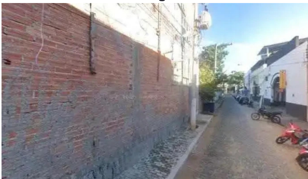
Farmacia ayrao de itaocara tudo