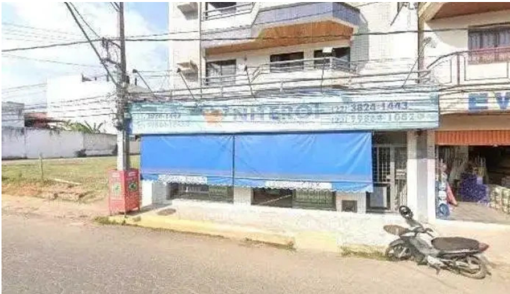
Drogaria blanc pharma tudo