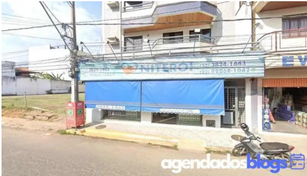
Drogaria blanc pharma itaperuna