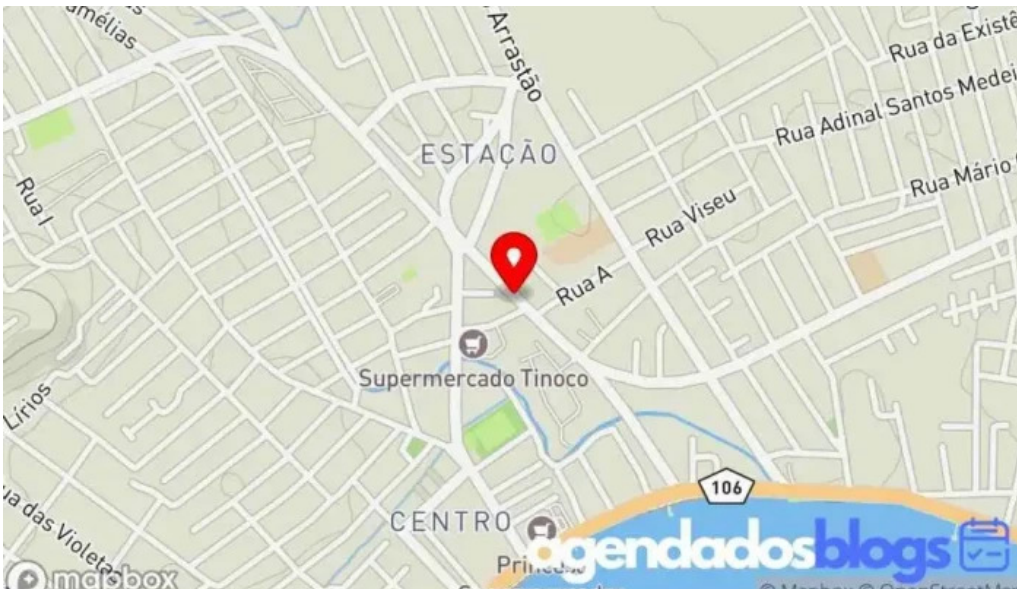
Farmacia prontofarma mapa