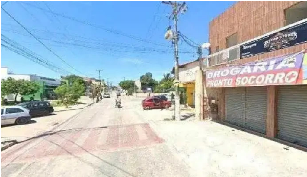
Farmacia prontofarma street view e 360deg