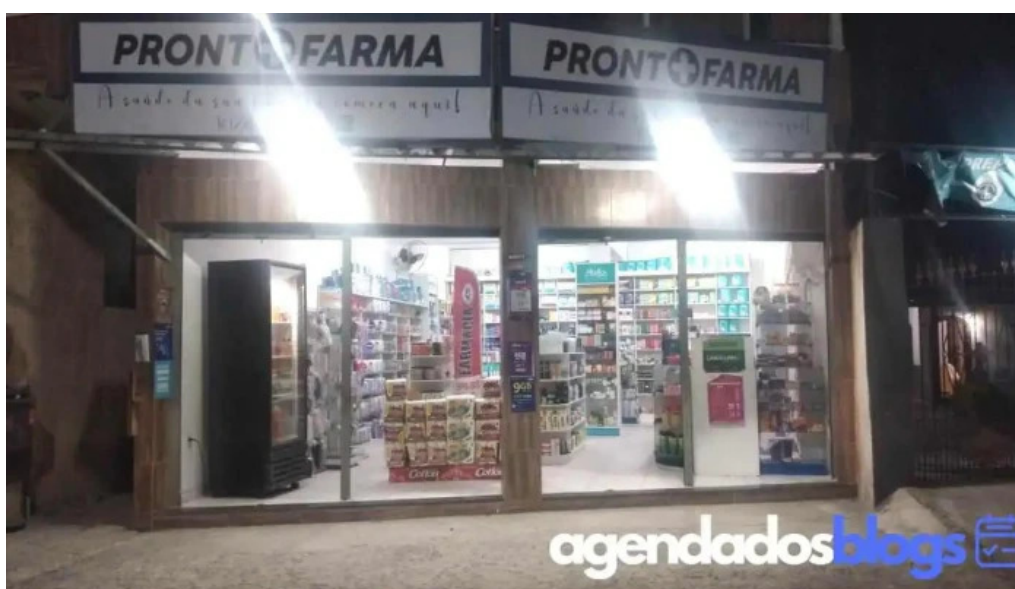
Farmacia prontfarma do proprietario