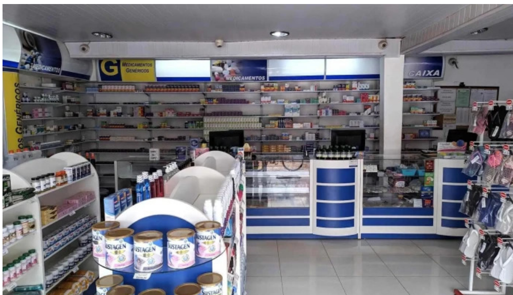
Drogalipe do proprietário